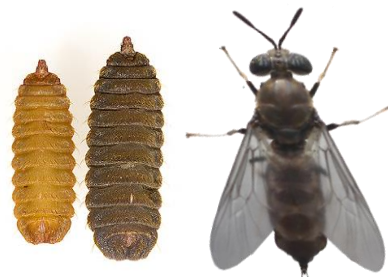
Gambar 1. Morfologi larva, pupa dan lalat dewasa BSF

Black Soldier Fly berwarna hitam dan bagian segmen basal abdomennya berwarna transparan ( wasp waist ) sehingga sekilas menyerupai abdomen lebah. Panjang lalat berkisar antara 15-20 mm dan mempunyai waktu hidup lima sampai delapan hari (Gambar 1). Saat lalat dewasa berkembang dari pupa, kondisi sayap masih terlipat kemudian mulai mengembang sempurna hingga menutupi bagian torak. Lalat dewasa tidak memiliki bagian mulut yang fungsional, karena lalat dewasa hanya beraktivitas untuk kawin dan bereproduksi sepanjang hidupnya. Kebutuhan nutrisi lalat dewasa tergantung pada kandungan lemak yang disimpan saat masa pupa. Ketika simpanan lemak habis, maka lalat akan mati (Makkar et al. 2014). Berdasarkan jenis kelaminnya, lalat betina umumnya memiliki daya tahan hidup yang lebih pendek dibandingkan dengan lalat jantan (Tomberlin et al. 2009).